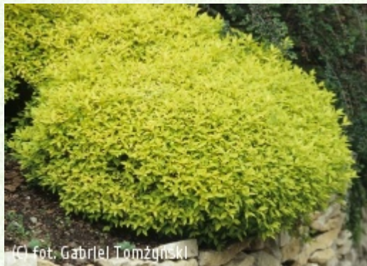
(c) fot. Gabriel Tomżyński (c) fot. Gabriel Tomżyński TOMŻYŃSKI Szkółka Roślin