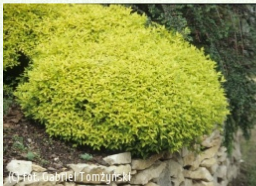
(c) fot. Gabriel Tomżyński (c) fot. Gabriel Tomżyński TOMŻYŃSKI Szkołka Roślin