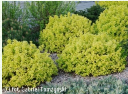
(c) fot. Gabriel Tomżyński (c) fot. Gabriel Tomżyński TOMŻYŃSKI Szkółka Roślin