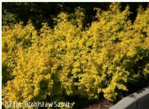
SZMIT Szkółka