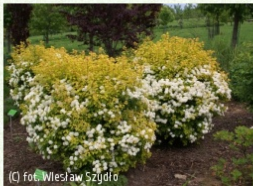
SZYDŁO Wiesław Szkółka Roślin Ozdobnych