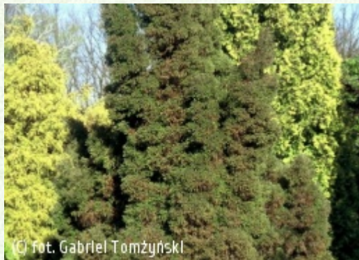
TOMŻYNSKI Szkołka Roślin