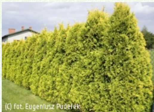
(C) fot. Eugeniusz Pudełek

(c) fot. Eugeniusz Pudełek PUDEŁEK Eugeniusz Szkołka Krzewów Ozdobnych