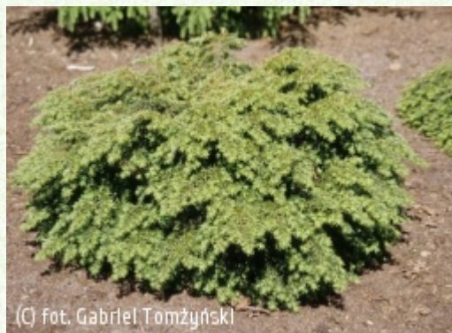
(c) fot. Gabriel Tomżyński TOMŻYŃSKI Szkołka Roślin