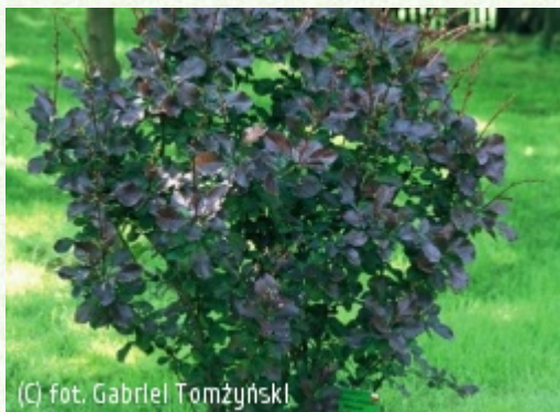
TOMŻYŃSKI Szkółka Roślin