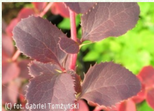
(C) fot. Gabriel Tomżyński (c) fot. Gabriel Tomżyński TOMŻYŃSKI Szkółka Roślin