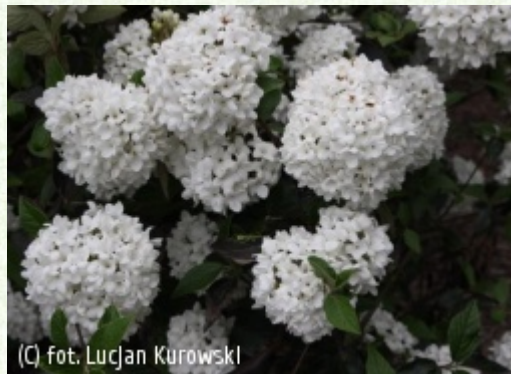
(C) fot. Lucjan Kurowski (c) fot. Lucjan Kurowski KUROWSCY Szkołki