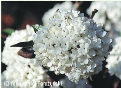
TOMZYŃSKI Szkołka Roślin