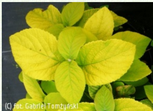
TOMŻYŃSKI Szkołka Roślin