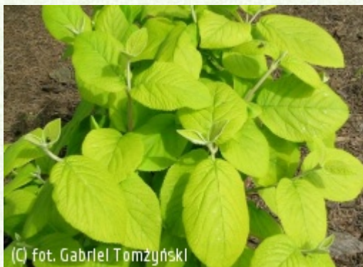
TOMŻYŃSKI Szkołka Roślin