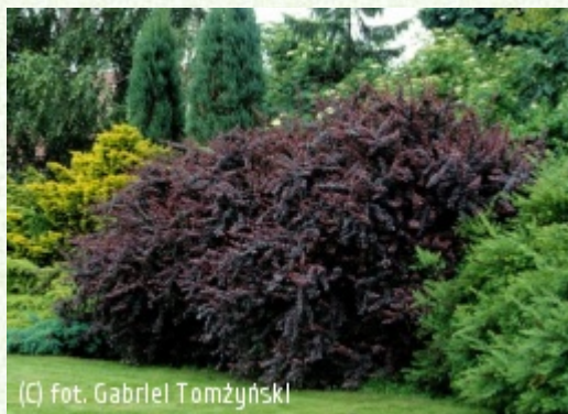
(C) fot. Gabriel Tomżyński

(c) fot. Gabriel Tomżyński TOMŻYŃSKI Szkołka Roślin