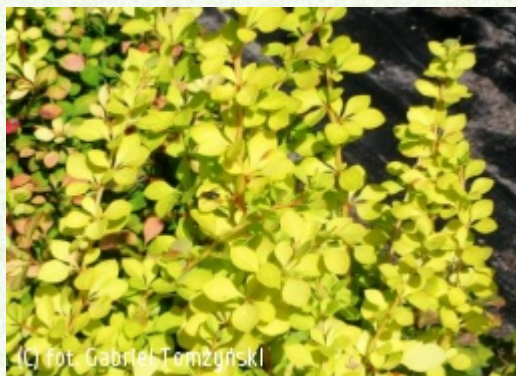
(c) fot. Gabriel Tomżyński (c) fot. Gabriel Tomżyński TOMŻYNSKI Szkołka Roślin