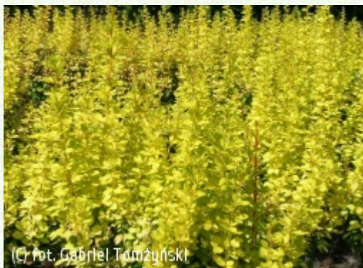
TOMŻYNSKI Szkołka Roślin