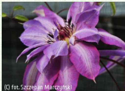
(c) fot. Szczepan Marczyński (c) fot. Szczepan Marczyński CLEMATIS Źródło Dobrych Pnączy Sp. z o.o. Spółka komandytowa

Polska odmiana, hodowli Stefana Franczaka, o jasnofioletoworóżowych kwiatach, średnicy 20-22 cm, najczęściej złożone z 6 – 8 wąskoełiptycznych, ostro zakończonych działek, z jasną, prawie białą pręgą przez środek. Pręciki mają purpurowe pylniki na kremowych nitkach. Kwitnie bardzo obficie w drugiej połowie maja i w czerwcu, a po obcięciu przekwitłych kwiatów, ponownie, ale mniej intensywnie, w sierpniu i wrześniu. Osiąga wysokość 2,5-3m. Podpór czepia się ogonkami liściowymi. Przydatna do uprawy przy ogrodzeniach, altanach, kratkach, tyczkach i innych podporach ogrodowych. Może wspinać się po naturalnych podporach, np. krzewach liściastych lub iglastych oraz krzewinkach niewymagających silnego cięcia. Dobra do uprawy pojemnikowej.