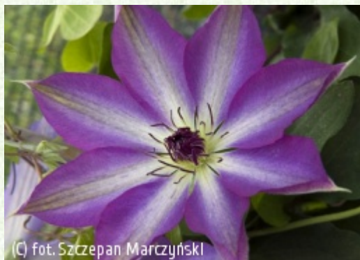
(c) fot. Szczepan Marczyński (c) fot. Szczepan Marczyński CLEMATIS Źródło Dobrych Pnączy Sp. z o.o. Spółka komandytowa

Grupa Early Large-flowered (incl. Patens, Fortunei & Florida)