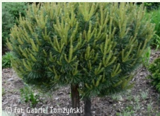
TOMZYNSKI Szkołka Roślin