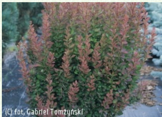
TOMZYNSKI Szkołka Roślin