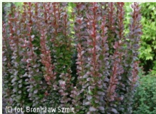
SZMIT Szkołka