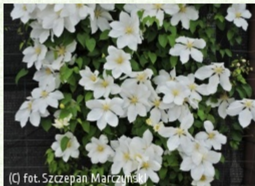
CLEMATIS Źródło Dobrych Pnączy Sp. z o.o. Spółka komandytowa