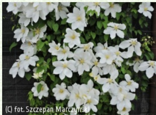
(C) fot. Szczepan Marczyński

(c) fot. Szczepan Marczyński CLEMATIS Źródło Dobrych Pnączy Sp. z o.o. Spółka komandytowa