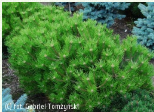
TOMZYŃSKI Szkołka Roślin