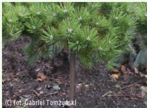
TOMZYŃSKI Szkołka Roślin