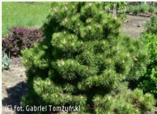
(c) fot. Gabriel Tomżyński (c) fot. Gabriel Tomżyński TOMŻYŃSKI Szkołka Roślin