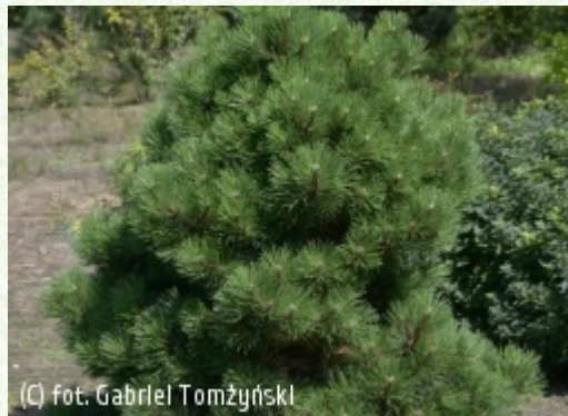
(c) fot. Gabriel Tomżyński (c) fot. Gabriel Tomżyński TOMŻYŃSKI Szkołka Roślin