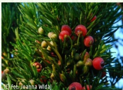
(c) fot. Joanna Widaj ACROCONA Szkółki Drzew i Krzewów Ozdobnych