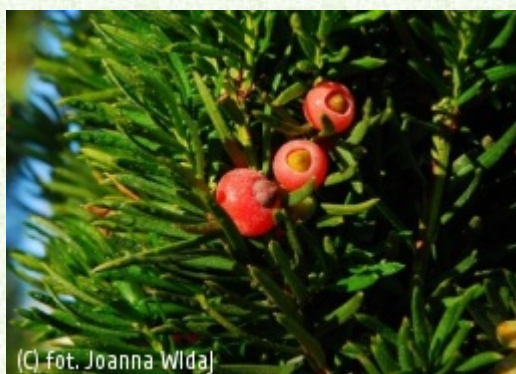
(c) fot. Joanna Widaj ACROCONA Szkółki Drzew i Krzewów Ozdobnych