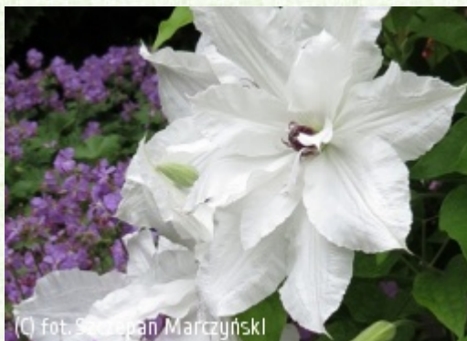
(C) fot. Szczepan Marczyński

(c) fot. Szczepan Marczyński CLEMATIS Źródło Dobrych Pnączy Sp. z o.o. Spółka komandytowa