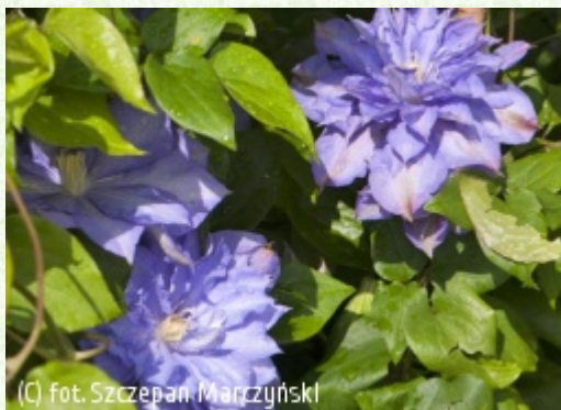
(C) fot. Szczepan Marczyński

(c) fot. Szczepan Marczyński CLEMATIS Źródło Dobrych Pnączy Sp. z o.o. Spółka komandytowa