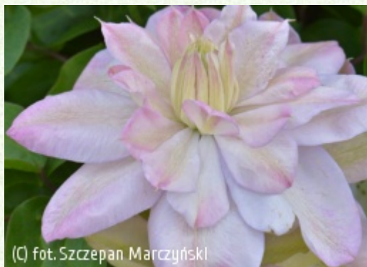
(C) fot. Szczepan Marczyński

(c) fot. Szczepan Marczyński CLEMATIS Źródło Dobrych Pnączy Sp. z o.o. Spółka komandytowa