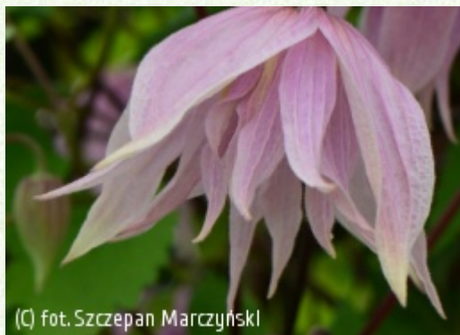
(c) fot. Szczepan Marczyński (c) fot. Szczepan Marczyński CLEMATIS Źródło Dobrych Pnączy Sp. z o.o. Spółka komandytowa