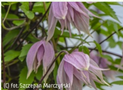
(c) fot. Szczepan Marczyński (c) fot. Szczepan Marczyński CLEMATIS Źródło Dobrych Pnączy Sp. z o.o. Spółka komandytowa