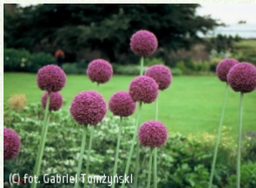
(c) fot. Gabriel Tomżyński (c) fot. Gabriel Tomżyński TOMŻYŃSKI Szkołka Roślin