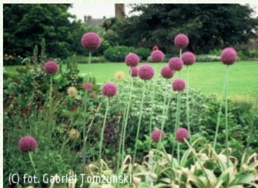
(c) fot. Gabriel Tomżyński (c) fot. Gabriel Tomżyński TOMŻYŃSKI Szkołka Roślin