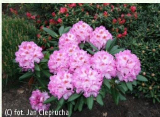
(C) fot. Jan Cieplucha

(c) fot. Jan Cieplucha CIEPLUCHA Gospodarstwo Szkółkarskie