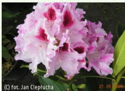
(c) fot. Jan Cieplucha CIEPŁUCHA Gospodarstwo Szkółkarskie