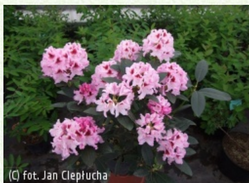
(c) fot. Jan Cieplucha CIEPŁUCHA Gospodarstwo Szkółkarskie