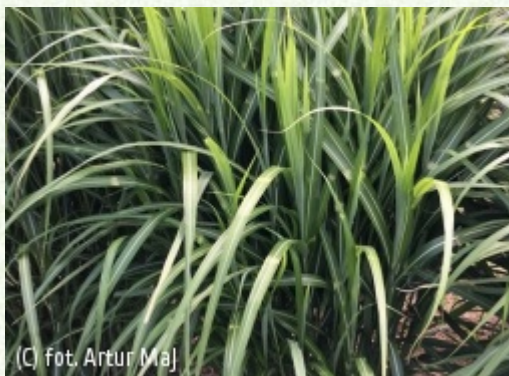
DAGLEZJA Artur Maj Szkołka Roślin Ozdobnych