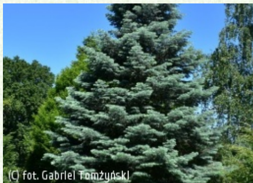
(C) fot. Gabriel Tomżyński

(c) fot. Gabriel Tomżyński TOMŻYŃSKI Szkołka Roślin