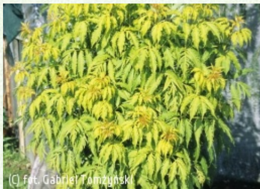
TOMZYNSKI Szkołka Roślin