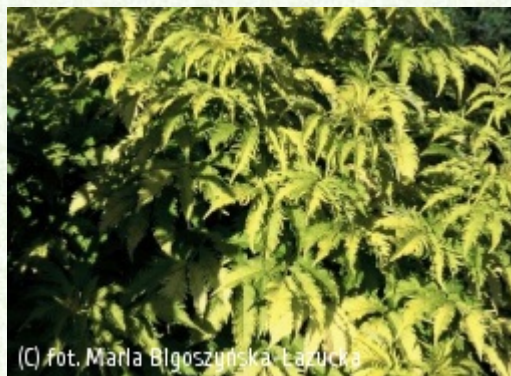
(C) fot. Maria Bigoszyńska-Łazucka (c) fot. Maria Bigoszyńska-Łazucka ŁAZUCCY Gospodarstwo Szkółkarskie