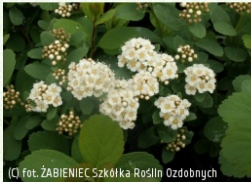
(C) fot. ŻABIENIEC Szkołka Roślin Ozdobnych (c) fot. ŻABIENIEC Szkołka Roślin Ozdobnych HOMA-KOSAKOWSKA Krystyna, Homa Emil, Kosakowski Krystian Szkołka Roślin Ozdobnych