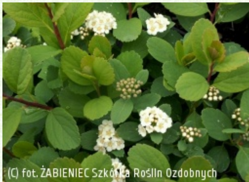
(C) fot. ŻABIENIEC Szkołka Roślin Ozdobnych (c) fot. ŻABIENIEC Szkołka Roślin Ozdobnych HOMA-KOSAKOWSKA Krystyna, Homa Emil, Kosakowski Krystian Szkołka Roślin Ozdobnych