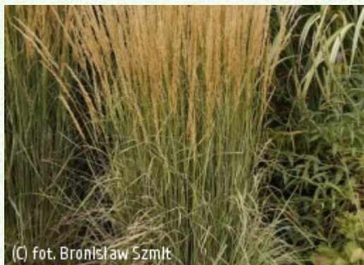
(C) fot. Bronisław Szmit (c) fot. Bronisław Szmit SZMIT Szkołka